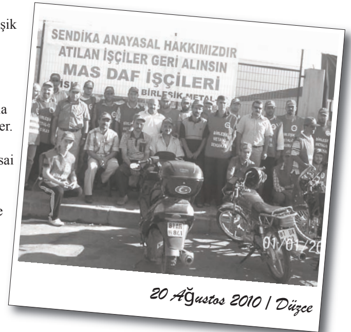
20 Ağustos 2010 | Düzce

PTT emekçilerinin biriken sorunlara tahammülü kalmadığının vurgulandığı açıklamada, emekçilerin sorunlarına çözüm bekledikleri söylendi. Bugüne kadar yapılan toplu görüşmelerde PTT emekçilerinin çalışma koşullarının iyileştirilmesine, sorunların